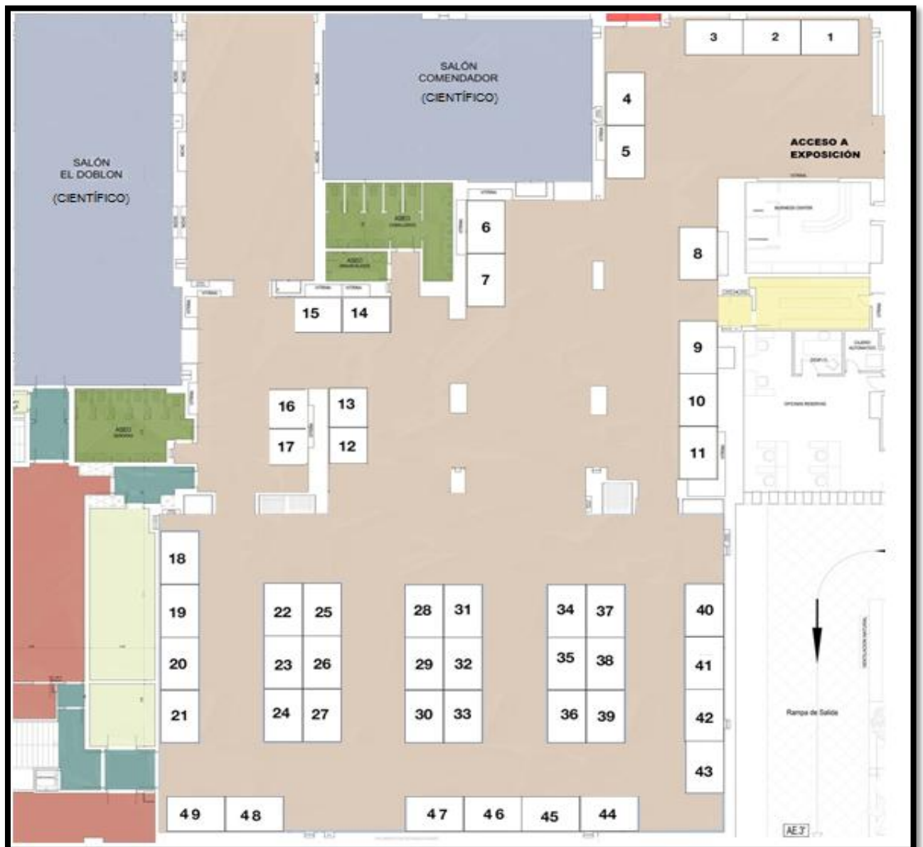
Plano sujeto a modificaciones